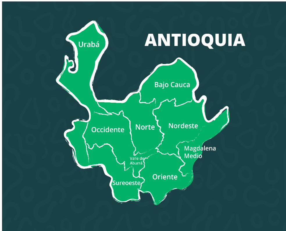
Gráfico 1. Mapa del departamento de Antioquia con sus subregiones. (Elaboración propia)

Antioquia es un departamento de Colombia localizado al noroeste del país. Ocupa un territorio de 63.612 km 2 que limita al norte con el mar Caribe y con el departamento de Córdoba; al occidente con el departamento del Chocó; al oriente con los departamentos de Bolívar, Santander y Boyacá; y al sur con los departamentos de Caldas y Risaralda. Es el 6º departamento más extenso de Colombia, y el más poblado, si se tiene en cuenta que el distrito capital de Bogotá es una entidad administrativa especial. Su organización territorial comprende nueve subregiones y su capital es la ciudad de Medellín.