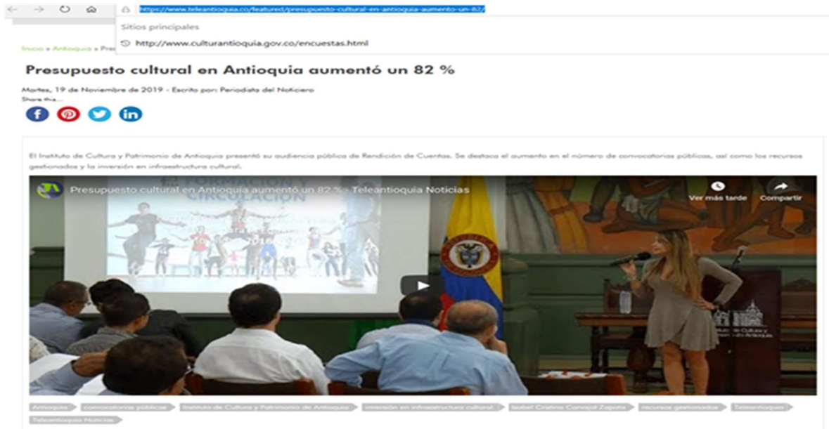
Imagen tomada del momento de la audiencia de la rendición de cuentas.