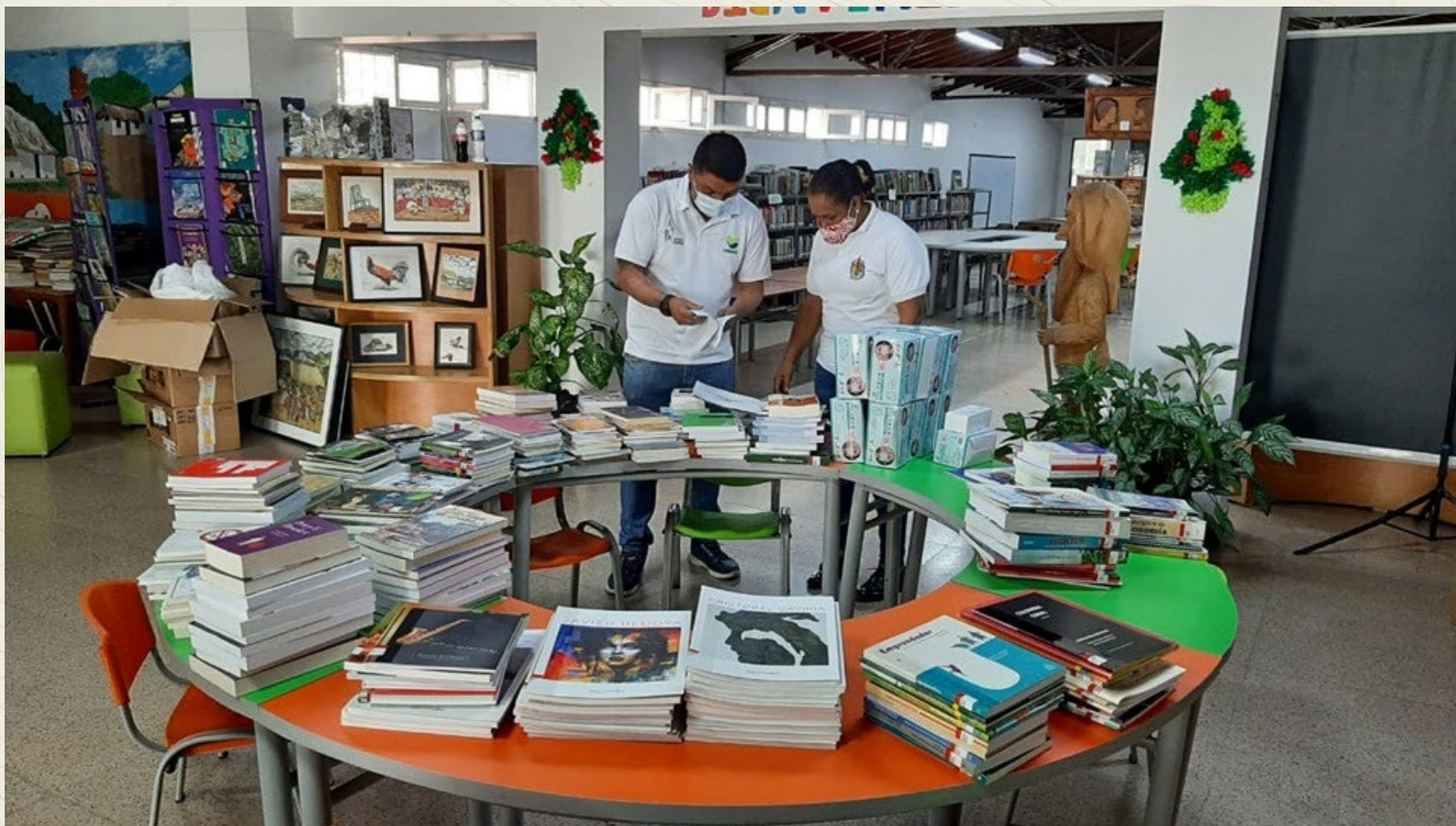
Dotación Bibliográfica Suroeste, Municipio de Ciudad Bolívar Oficina de Comunicaciones