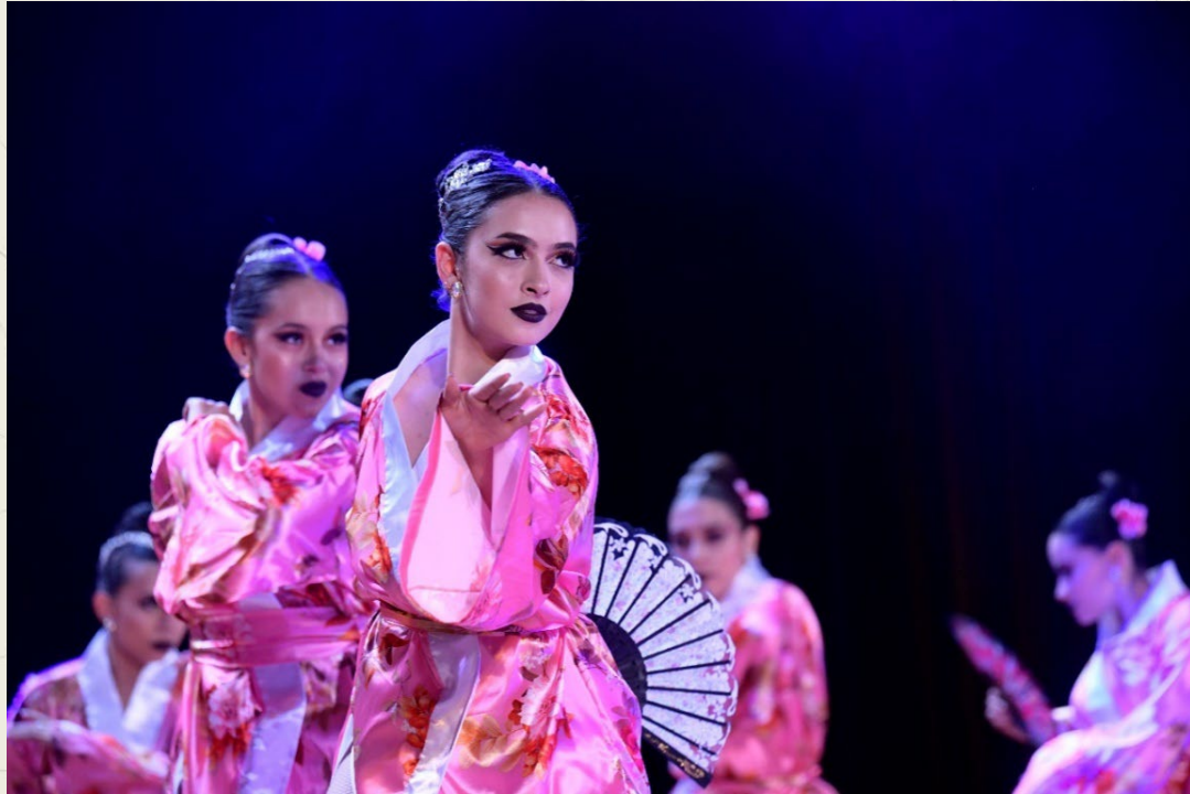
|| Antioquia Vive la Música Oriente, municipio de Marinilla Oficina de comunicaciones