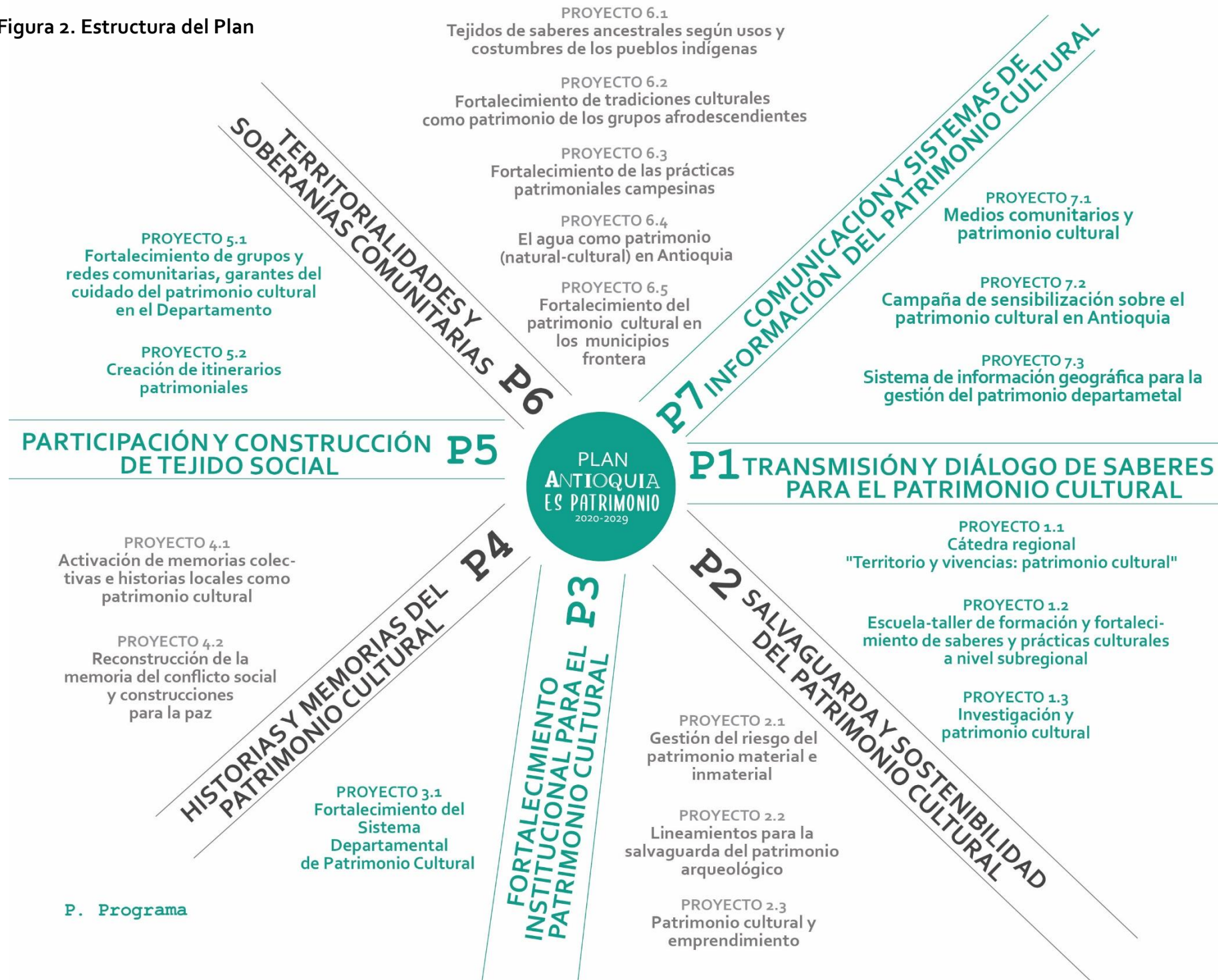
Figura 2. Estructura del Plan